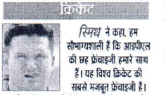
रिमथ ने कहा, हम सौभाग्यशाली हैं कि आइपीएल की छह प्रेचाइजी हमारे साथ हैं यह विश्व क्रिकेट की सबसे मजबूत प्रेचाइजी है। कई स्तरों पर उनकी विशेषज्ञता हमारे काम आई।

विश्व आजीवा के पूर्व कप्तान ग्रीम रिमथ का मानना है कि हाल में समाप्त हुए एसए20 टूर्नामेंट की सफलता में आइपीएल की भूमिका महत्वपूर्ण (आइपीएल) की छह प्रेचाइजी ने महत्वपूर्ण भूमिका निभाई। एसए20 में छह प्रेचाइजी टीमों एमआइ केप टाउन, जार्वन सुपर किंग्स, डरबन सुपर जवाइंट्स, पातल गणपत, फिरोजिया कैपिटल्स और वनसराजर्स इटरेन केप ने हिस्सा लिया। इन सभी टीमों का स्वामित्व आइपीएल टीमों के मालिकों के पास है। रिमथ ने मंगलवार को संवाददाता सम्मेलन में कहा, हम सौभाग्यशाली हैं कि आइपीएल की छह प्रेचाइजी हमारे साथ हैं। यह विश्व क्रिकेट की सबसे मजबूत प्रेचाइजी है। कई स्तरों पर उनकी विशेषज्ञता हमारे काम आई। इस 46 वर्षीय क्रिकेटर के एक खिलाड़ी