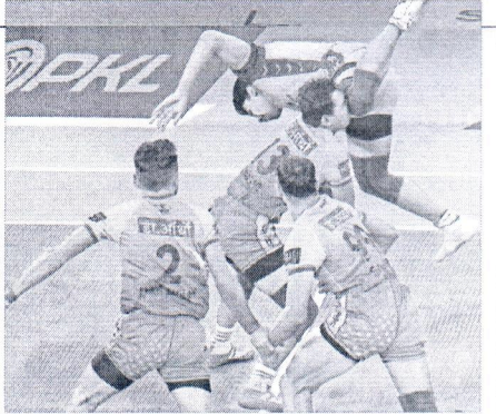
कोलकाता : नेताजी इंडोर स्टेडियम में मंगलवार को प्रो कबड्डी लीग मैच के दौरान पटना पाइरेट्स (हरे रंग में) और तेलुगू टाइटंस के खिलाड़ी।