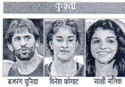
बजराग पुनिया विनेश फोगाट साक्षी मलिक

भारतीय कुरुती महासच (डब्ल्यूएफआइ) के समय पर चुनाव नहीं करा जाने के कारण यूडब्लूडब्लू ने पिछले साल 23 अगस्त को उसे निलंबित कर दिया था। विश्व संस्था ने बयान में कहा, यूडब्लूडब्लू व्यूरो की निलंबन की समीक्षा करने और अन्य विषयों पर चर्चा करने के लिए 9 फरवरी को बैठक हुई तथा सभी तथ्यों पर गौर करने के बाद निलंबन हटाने का फैसला किया गया। बयान में कहा गया है, डब्ल्यूएफआइ को वरुत ही डब्ल्यूडब्लू की लिखित गांठी देनी होगी कि डब्ल्यूएफआइ की सभी प्रतिबोधिताओं विषय कर